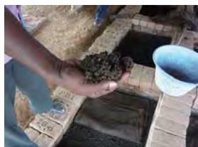
(上) 営業担当と本社オフィスにて (中) 有機マンゴー農園の様子 (下) 堆肥作り場

インドは南部バンガロールの本社から約 3 時間、更に南へ進みタミル・ナドゥ州にある田舎町へ。年間平均気温は 28 度、年間通して半袖で過ごせる地域です。