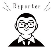
営業担当 橋本 将太

濃厚な味で 1 度食べるとやみつきになるインド産マンゴー。色鮮やかで実は肉厚。ただ甘いだけでなく、酸味、野性味も感じられる美味しい「マンゴーの王様」、アルフォンソマンゴーをお楽しみに！